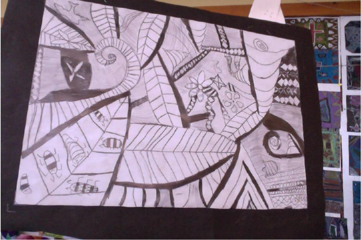
tusia e Italia McLeay. Yr 5